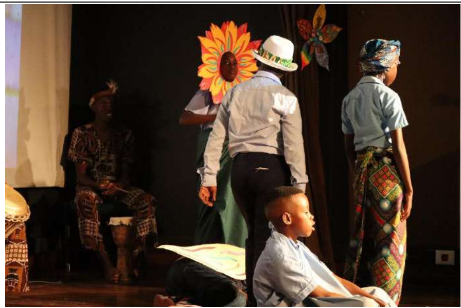
- Peça de teatro do conto "O lagarto" representado pelo grupo de teatro da escola – pré- escolar, 1.º 2.º e 3.º ciclos