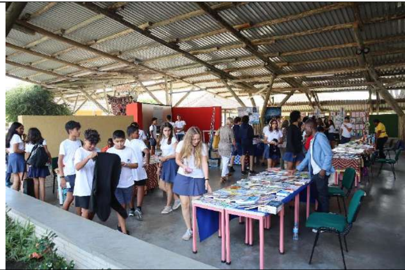
Lançamento do Livro "Lamura"