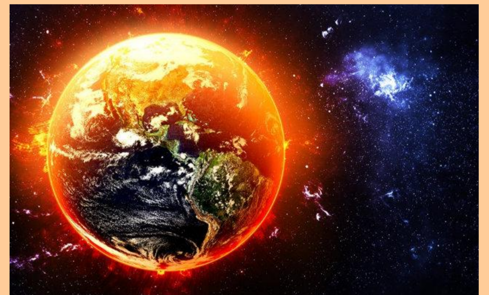
Fig.2 Aquecimento Global

Se não mudarmos os nossos hábitos não estaremos só a ser ignorantes com as consequências que o aquecimento global gera no nosso planeta, para não falar nas alterações climáticas que lhes sucedem, estaremos a ser ignorantes com a nossa própria casa e com a nossa própria vida.