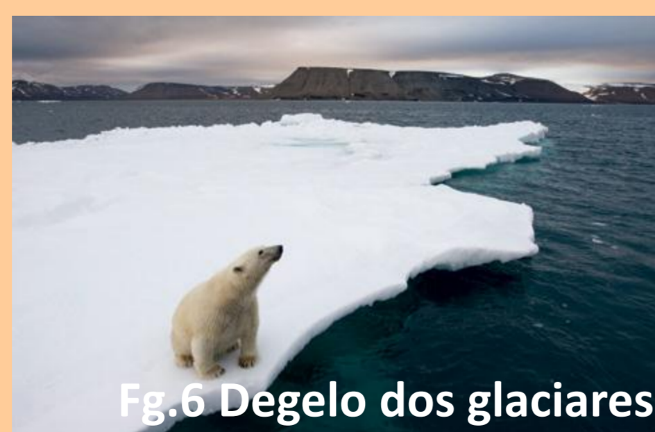
Fig.6 Degelo dos glaciares